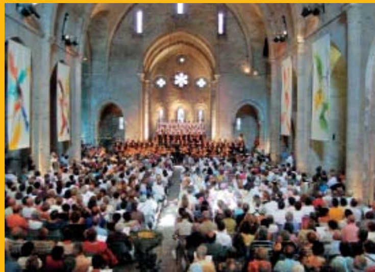
Festival de l'Abbaye

Centre International de Rencontres Culturelles et musicales, elle offre pendant neuf mois un riche programme d'activités : stages de chant, d'art pictural, colloques, rencontres spirituelles, festival du film, programmation de spectacles pour le jeune public et les familles, ateliers de pratique artistique pour les scolaires, voyages culturels et bien sûr un Festival International de Musique Sacrée (33 e édition en 2010).